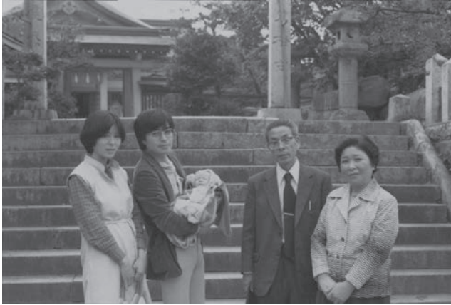
初孫の誕生時（福岡市・紅葉八幡の前で）