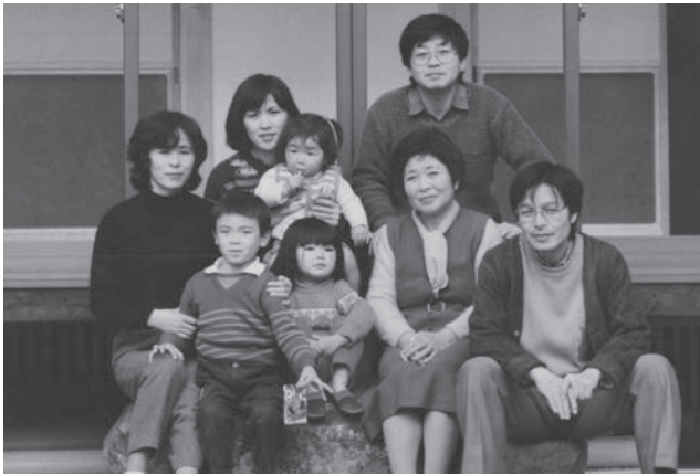
長男・次男家族と